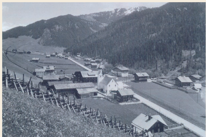
Gerlos Anfang der 50er Jahre.