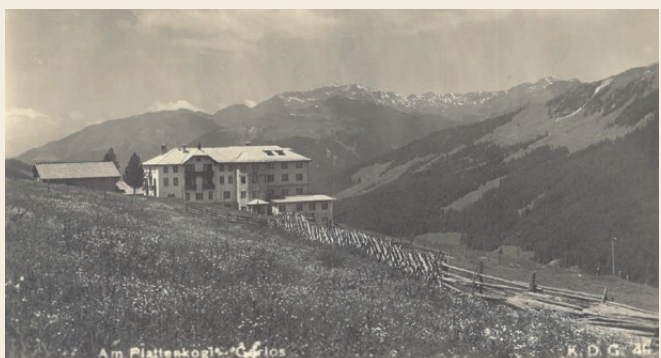
Am Plattenkogel - Gerlos.