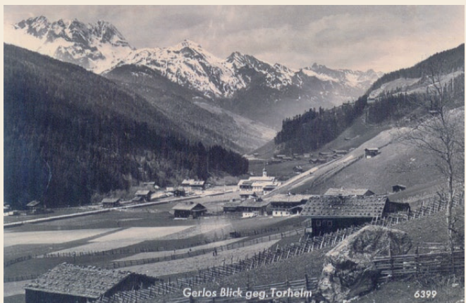
Gerlos mit Blick gegen Brandberger Kolm und Torhelm.