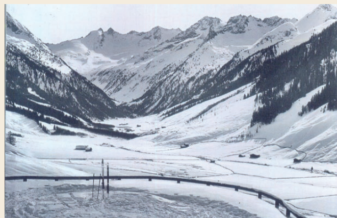
Wildgerlostal mit den Almen, bevor der Stausee gebaut wurde. Im Hintergrund Gabler & Reichenspitze.